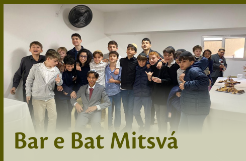
Bar e Bat Mitsvá