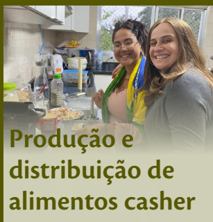
Produção e distribuição de alimentos casher