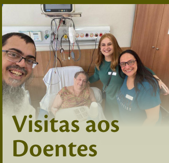
Visitas aos Doentes