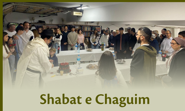
Shabat e Chaguim