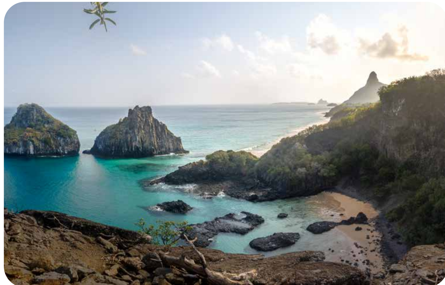
Baia dos Porcos, Morro Dois Irmaos e Morro do Pico - Fernando de Noronha, Brazil